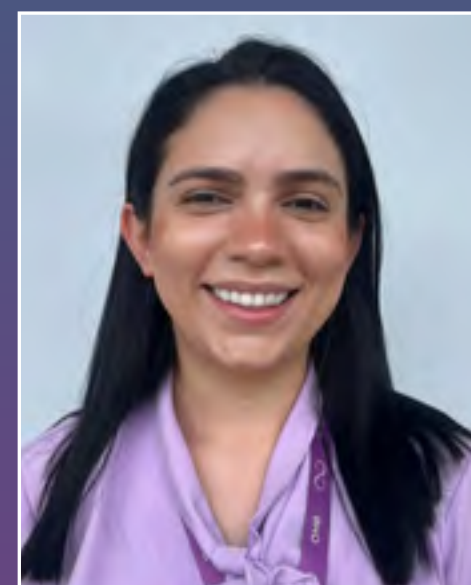
Iana Sousa Time de Condomínio