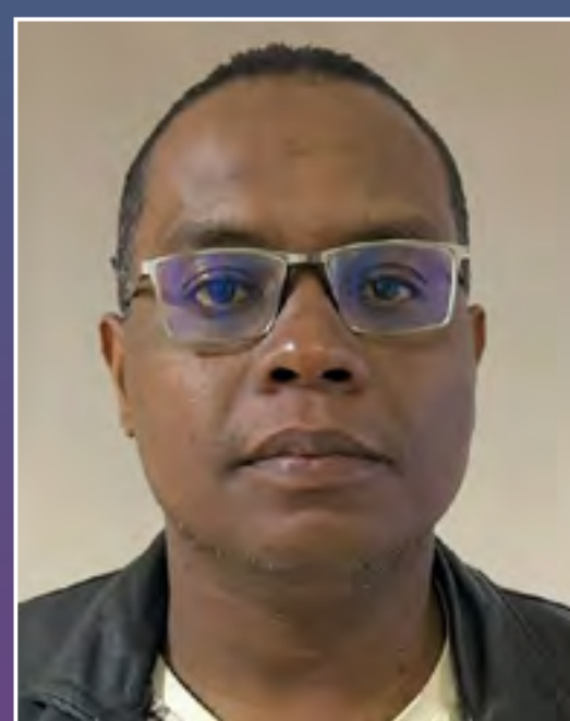
Alexandre Time monitoramento